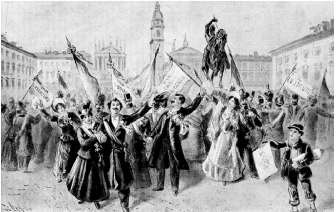
poche settimane dopo il 27 febbraio, festa nazionale e Te Deum alla Gran Madre di Dio